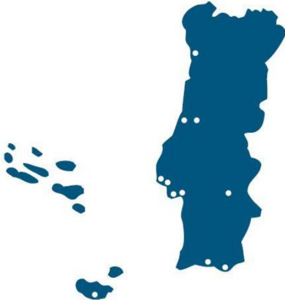
Figura 1 – Mapa com a localização das delegações do CASA

O CASA conta com 11 delegações no território de Portugal: Albufeira, Azeitão, Cascais, Coimbra, Évora, Faro, Figueira da Foz, Lisboa, Porto, Região Autónoma da Madeira e Setúbal.